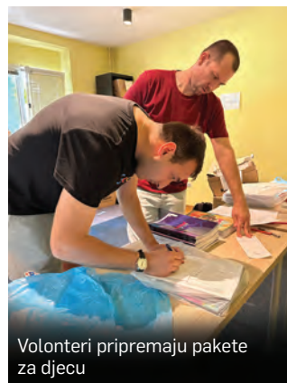
Volonteri pripremaju pakete za djecu

Udruga se trenutačno brine o gotovo 400 djece iz ekonomski ugroženih obitelji iz cijele Hrvatske, djelujući pritom isključivo zahvaljujući nesebičnim donacijama građana, tvrtki i angažmanu brojnih volontera. M. Mladić