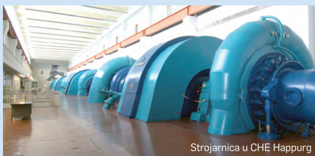
Strojarnica u CHE Happurg

Uniper Kraftwerke planira ponovno pokrenuti CHE Happurg, što zahtijeva opsežne mjere revitalizacije. Nakon