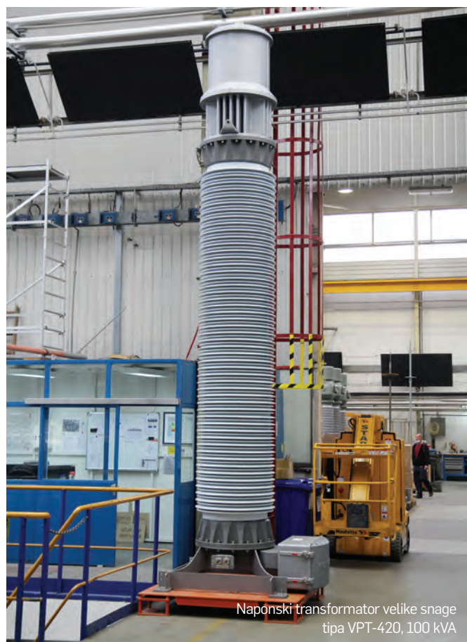
Naponski transformator velike snage tipa VPT-420, 100 kVA

Transformatori se isporučuju u sklopu izgradnje šest novih transformatorskih stanica – Alto Lindoso, Vale de Pereiro, Lares, Arouca, Vilarouco i Pego. M. Mladić