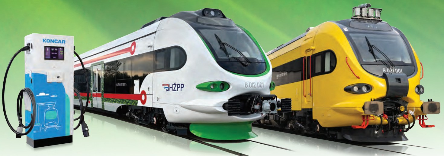
Punionica za baterijske vlakove

Posjetite nas u paviljonu 3.2 na izložbenom prostoru br. 470 te vanjskom prostoru FGSUED, tračnice T4/20 i T4/25