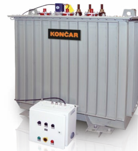
Regelbarer Ortsnetztransformator / Voltage regulated distribution transformer

Prior to delivery all transformers are routine tested according to standard IEC 60076 (if required, acc. to other standards also). On customer's request, type and special tests are carried out.