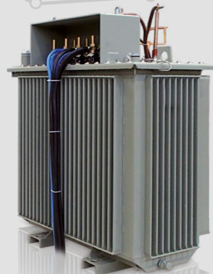
Verteilungstransformator mit reduzierter elektromagnetischer Strahlung / Distribution transformer with reduced EM radiation

Alle ausgelieferten Transformatoren werden gemäß IEC 60076 stückgeprüft. Falls erforderlich können auch Prüfungen gemäß anderen nationale Normen und Vorschriften durchgeführt werden. Typen- und Sonderprüfungen werden gemäß Kundenspezifikation durchgeführt.